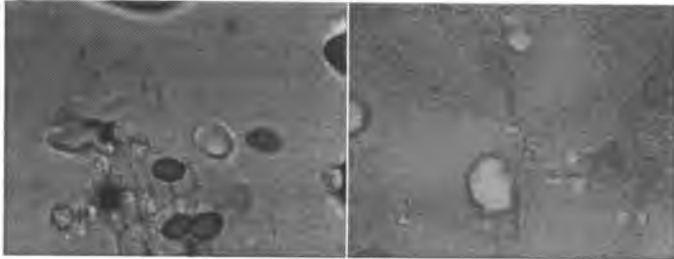
Мікрофотографія спор та гіф Cladosporium sp. (1) та Chaetomium sp. (2). Фарбування за Люголем, збільшення x1000

У 2013 р. Українським науково-дослідним інститутом архівної справи та документознавства було розроблено методика проведення превентивних та профілактично-контрольних заходів для захисту документів НАФ від біодеструкції [9], на підставі якої почало проводитись дослідження мікробіологічного та ентомологічного стану архівосховищ та документів державних архівів з метою проведення моніторингу стану збереженості документів Національного архівного фонду, формування сучасної системи біозахисту та профілактики біоуражень архівосховищ та документів державних архівів.